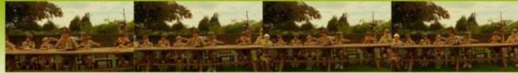
© Wes Anderson / Columbia Pictures